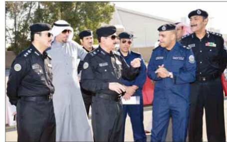
• اللواء، عميداً مهتماً يستمع إلى شرح عن الاختبارات الجديدة

وتوفر KMC التعليم النظري من خلال الفصول الدراسية، وأجهزة المحاكاة الحديثة المعدة لهذا الغرض، ويشمل التدريب النظري على موضوعات «قوانين المرور، سلوكيات القيادة، الإشارات المرورية، ميكانيكا السيارات، الإسعافات الأولية».