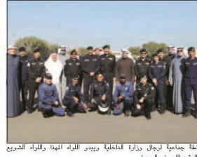
مفلة جماعية لرجال وزارة الداخلية وبيدو اللواء المنيا واللواء الضريع والديف المهر في الرسم