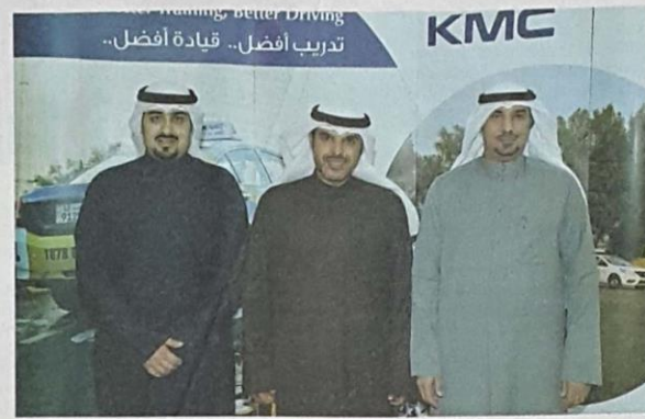
Kuwait Motoring Company officials.