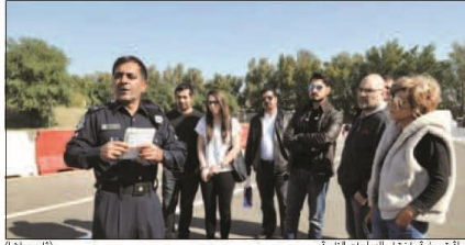
جولة تدريبية باختبار الدراجات النارية