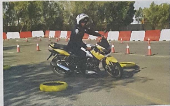
An officer demonstrates motorbike training techniques at Kuwait Motoring Company's new testing area.