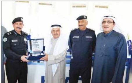
• ويتسلم درعاً تكريميةً بالإنسانية

كما تقدم الشركة التدريب على القيادة للرخص الخاصة والدراجات النارية والنقل الثقيل الشاحنات، الحافلات، المركبات الإنشائية» بالإضافة إلى برامج التدريب المتقدم لمركبات الجير العادي وقيادة الطرق غير الممهدة.